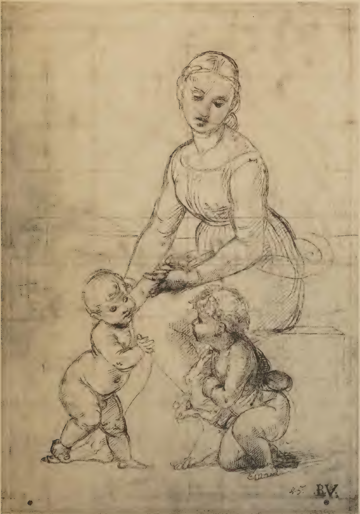
Etude pour la Belle Jardinière du Louvre